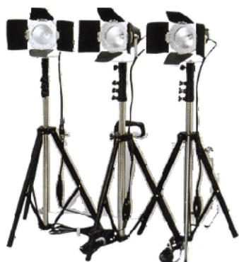
▲ロケーションライト▲