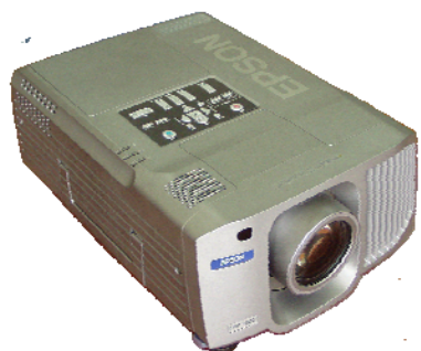
▲マルチメディアプロジェクター▲