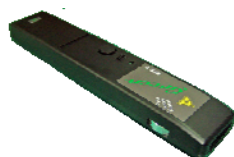
▲レーザーポインター▲