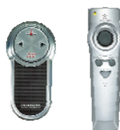
▲プレゼンテーション用マウス▲