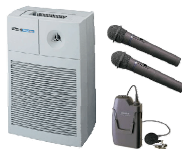
▲ワイヤレスアンプ▲