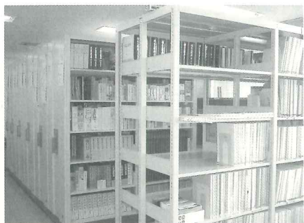
△教育研究所図書資料室

図書資料室(写真右)には、約八千冊の教育用図書があり、学校の先生がいつでも借りられるようになっています。また、全国の教育センター等の研究報告書のデータも一万件を超え、パソコンで検索できます。