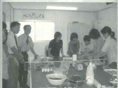
△教育研究員との交流調理実習