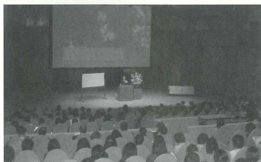
△教育文化講演会のようす

2月10日、佐敷町のシュガーホールにおいて文部科学省の永田繁雄教科調査官を招き、「心豊かで活力ある子どもを育てる学校教育」の演題で講演会を開催しました(写真左)。当日は島尻管内をはじめ他地区から400余名の教育関係者が参加しました。