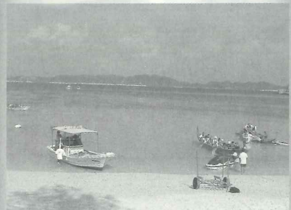
△きいき自然体験キャンプ(国立沖縄青年の家)11/5~9