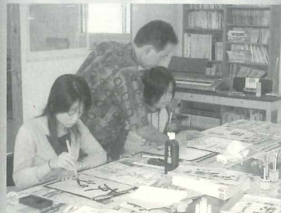
△ボランティア講師を招いて(書道)