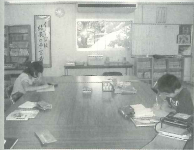
△日常の学習活動(個別学習)

「しのめ教室」では体験活動・学習活動教育相談を3つの柱として、児童生徒の学校復帰を支援します。