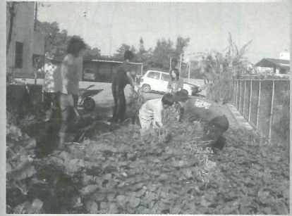
△農作業(いもの収穫)