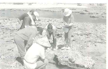
【海の生き物観察(具志頭)】