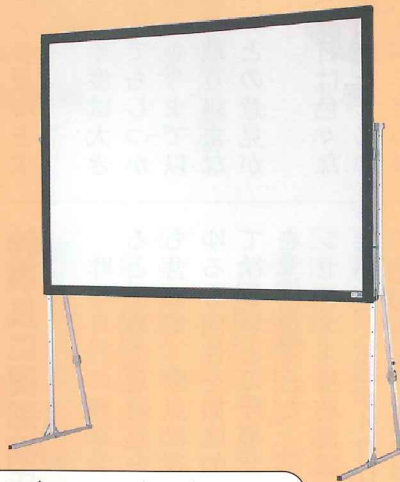
視聴覚ライブラリー(6P)