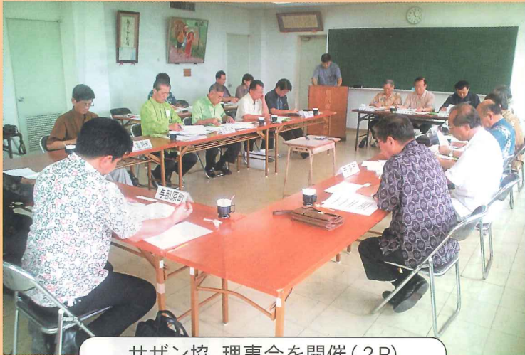
サザン協、理事会を開催(2P)