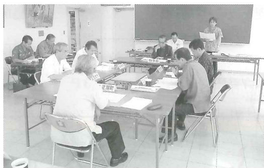
南部総合福祉センターにて

また、これまでに(10月末現在)8回の会議が行われ、サザン協事業の経緯や管内三清掃組合(島尻消防清掃組合、東部清掃施設組合、糸満市・豊見城市清掃施設組合)のこ