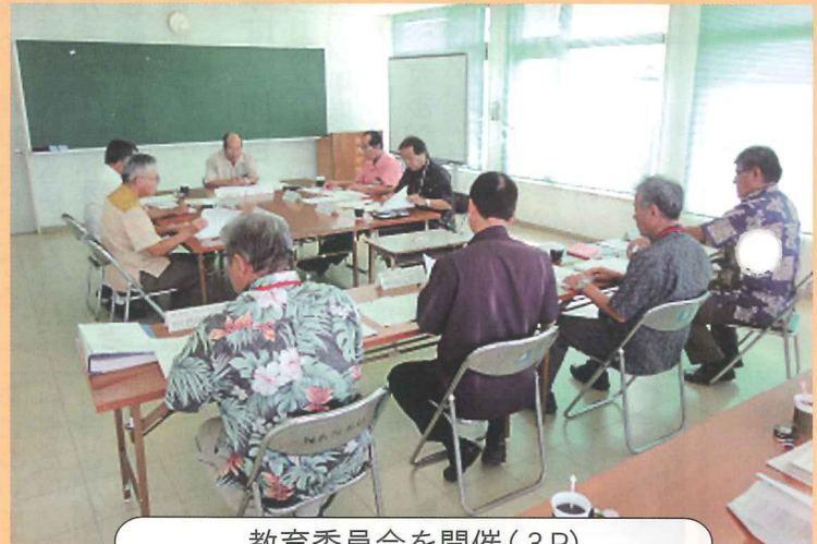
教育委員会を開催(3P)