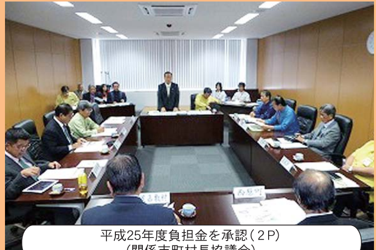
平成25年度負担金を承認(2 P) (関係市町村長協議会)