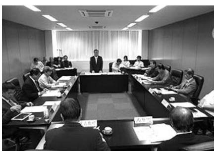
△関係市町村長協議会の様子△

☆負担金割合については現 行の人口割85%、均等割 15%から人口割42・5%、 受益者割42・5%、均等 割15%に変更