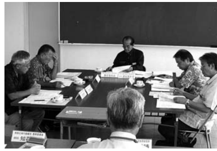
△組合教育委員会の様子△