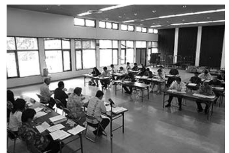
△財政課長・担当課長会の様子△

11月15日に構成13市町村 の関係市町村長協議会を開催 しました。 会議では、25年度負担金に ついて審議を行い、承認しま した。 組合はこの承認を経て、組 合構成市町村への負担金計上 依頼を行います。