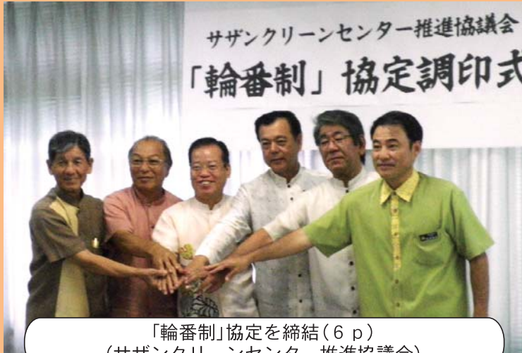
「輪番制」協定を締結(6 p) (サザンクリーンセンター推進協議会)