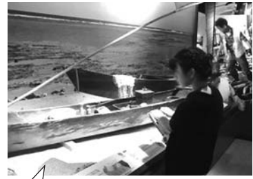
県立博物館にて見学中