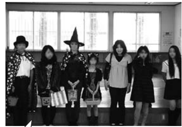
ハロウィンパーティ