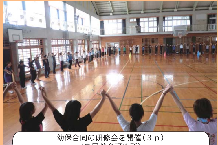
幼保合同の研修会を開催(3 p) (島尻教育研究所)