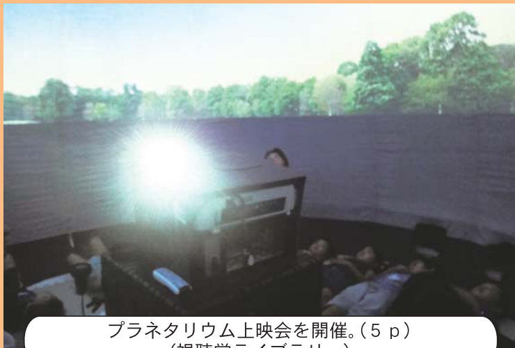
プラネタリウム上映会を開催。(5 p) (視聴覚ライブラリー)