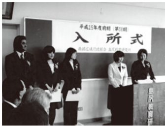
前期入所式の様子

幼稚園・小中学校教諭による六ヶ月の間の研修を行います。平成24年度後期までに234人の修了者を送り出しました。平成25年度前期は、幼稚園2名、小学校2名、中学校1名、の計5名の教育研究員が入所しました。昨年度に引き続き離島研究員（幼稚園）1名を含めて6名の研究員が各自のテーマ追究の他、所内外の研修を通して教員としての資質の向上を図っています。