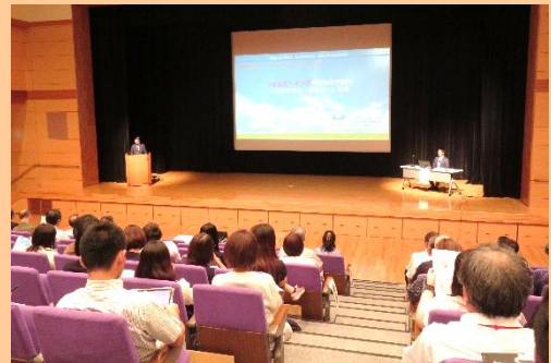
創立30周年記念教育講演会を開催

令和4年度より「広域広報なんぶ」は、紙媒体での配布を行わず、ホームページに掲載しお知らせします。