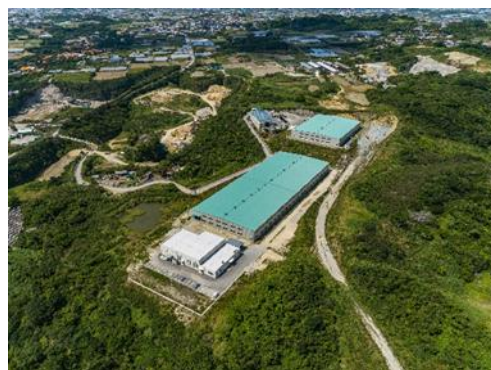
△美らグリーン南城（全景）△