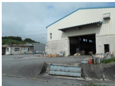
△島尻環境美化センター△