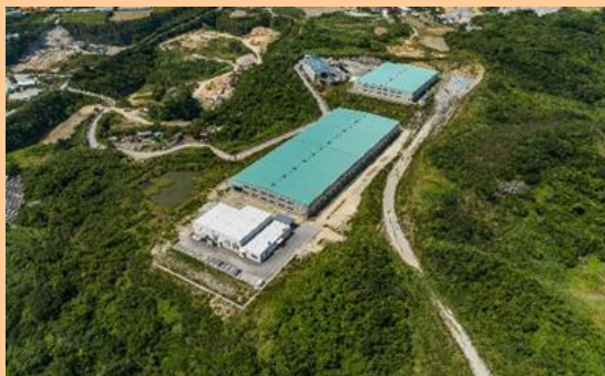
最終処分場 「美らグリーン南城」