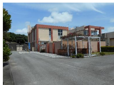
△し尿処理施設 清澄苑△