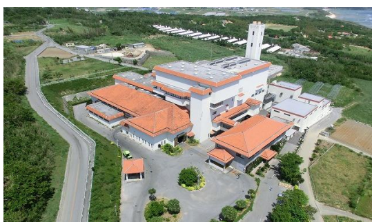
△糸豊環境美化センター△