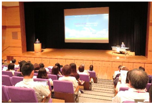
教育講演会の様子

関係者が参加し、学びのアップデートが行われました。教育講演会の参加者からは、「教員のウェルビーイングがこどもたちをサポートの充実につながる」と感じました。「一人一人が働きがいを感じる事ができる職場にするため、まずは自分自身の働き方を見直していきたい」などの感想が寄せられました。