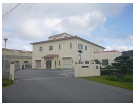
△汚泥再生処理センター△