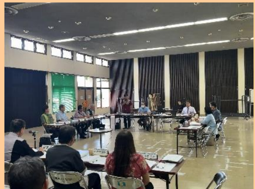
議会提出議案を協議