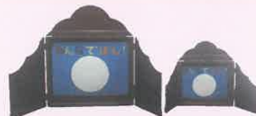
▲紙芝居用舞台(大・小)▲

〒901-0401 沖縄県島尻郡八重瀬町字東風平 9 6 5 番地 (南部総合福祉センター 2階)