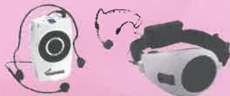
▲ハンズフリー拡声器▲