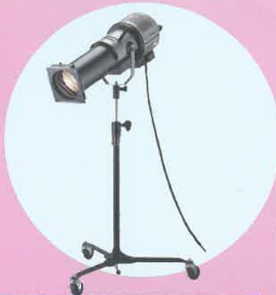
▲スポットライト(屋内用)▲