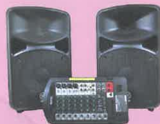
▲簡易PAシステム(屋内用)▲