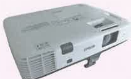
▲マルチメディアプロジェクター▲