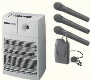
▲ワイヤレスアンプ▲