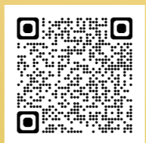
視聴覚ライブラリーHP