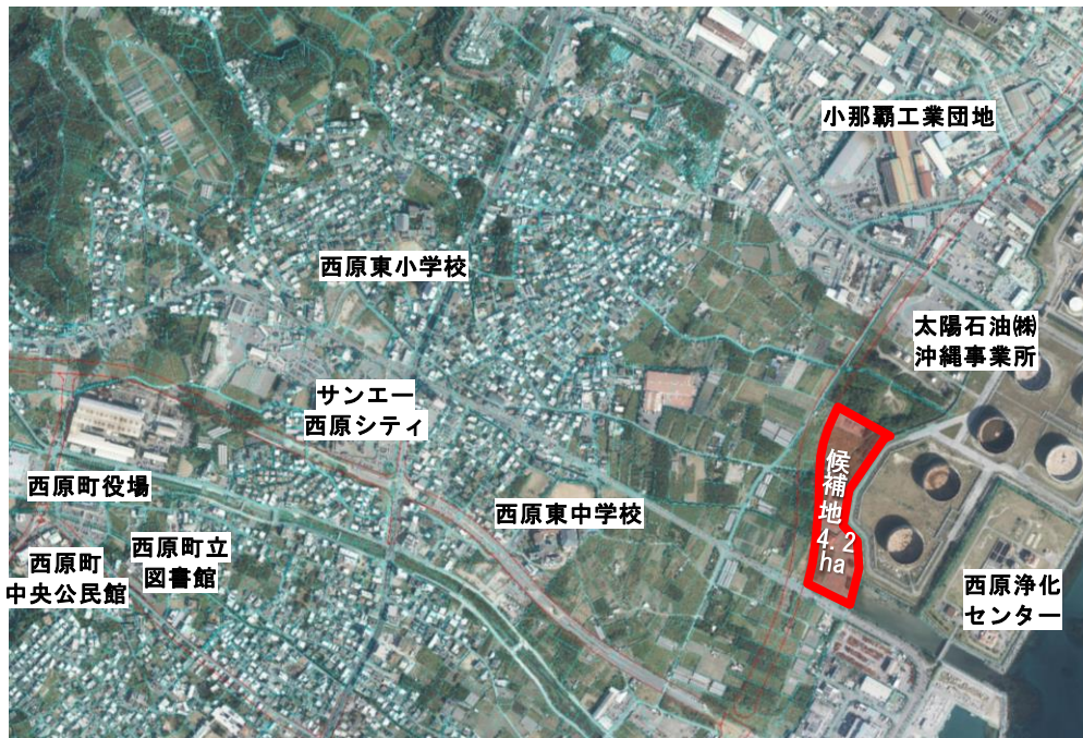
ごみ処理施設建設候補地 位置図

※1：環境衛生事務に関する議題に対して、構成市町（糸満市・豊見城市・南城市・八重瀬町・与那原町・西原町）の市長・町長が集まり協議し、決定していく機関