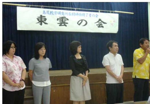
写真3 定例会での新役員承認