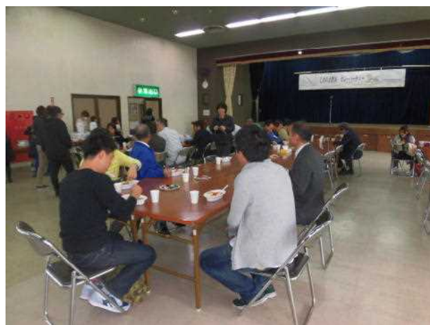
写真2 いただきます