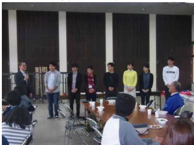
写真3 琉大の学生ボランティアの皆さん