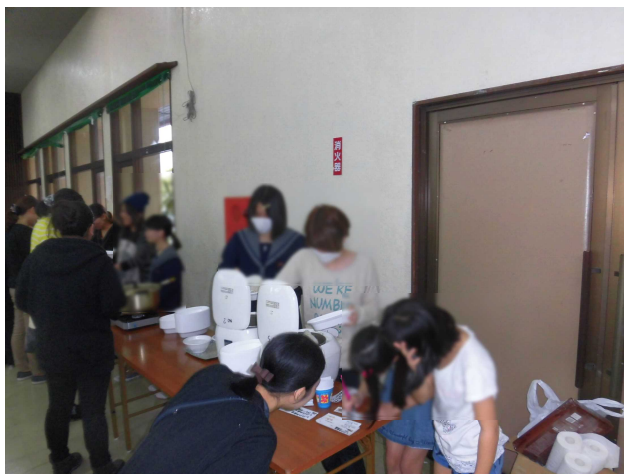
写真1 カレー、どうぞ

多くの方々の支援を頂き、子ども達は、この1年で心も体も大きく成長することができました。本当にありがとうございました。