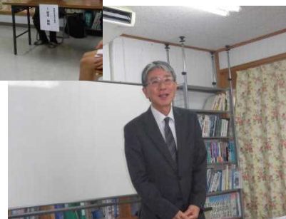
写真4 激励のあいさつ