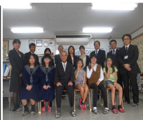
写真1 参加者全員で記念撮影