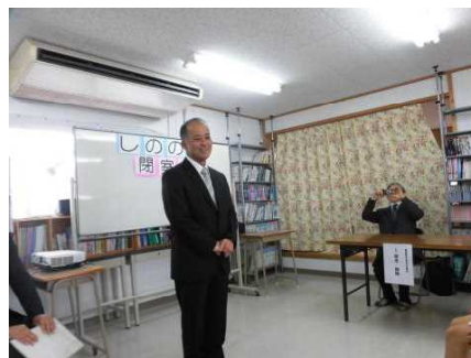
写真3 所長あいさつ