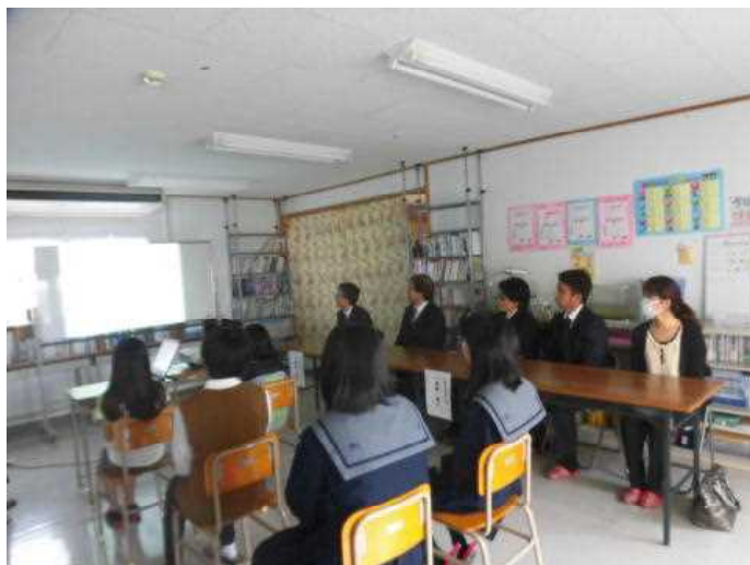
写真2 閉室式の様子