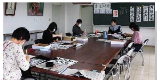
書道研修(毎週1回実施)