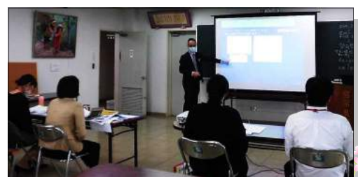
所内講座(学習指導要領、授業づくり等)