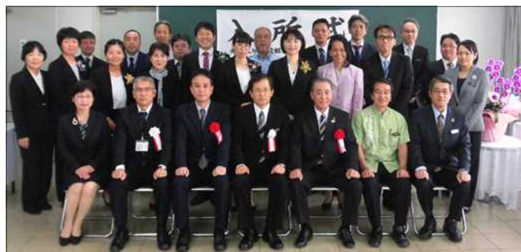
令和2年度前期入所式にて