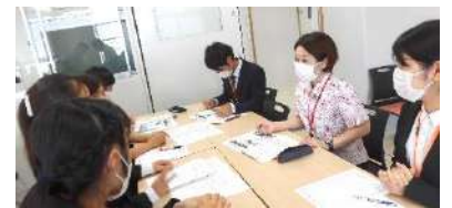
沖女学生グループと交流

7月12日(火)、沖縄女子短期大学初等教育コース2年次と交流学习を行いました。教育実習に不安を感じている学生もおり、交流を通して学生の本音、学校の現状、先輩教師としての思いを伝えることで、学生の教育実習への不安を和らげ、前向きな気持ちを引き出していました。これからの教育を担うであろう学生の目の輝きに研究員の皆さんも刺激を受け、改めて教育の素晴らしさを実感する有意義な時間になりました。