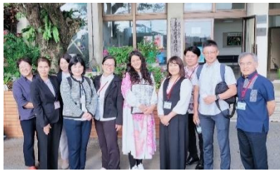
石垣・宮古島研究員と集合写真