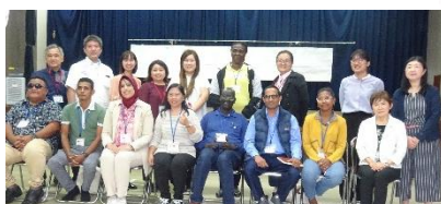
JICA 研究員と集合写真