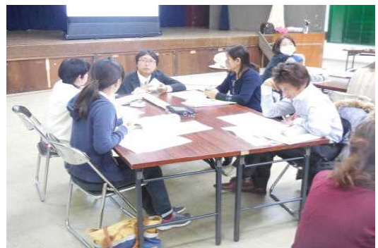
写真2 個人ワークの様子