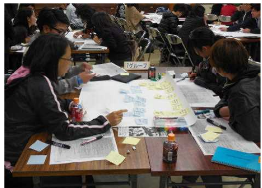
写真3 付箋紙を活用したグループワーク